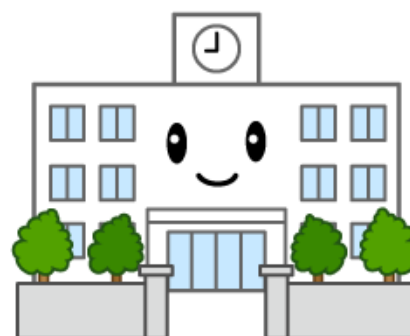
All Parsons School