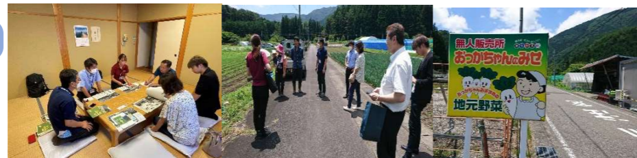
井川支所との話し合い

静岡県オクシズ（井川地区）では、在来作物（蕎麦、粟、稗等の120種類）を栽培し、規格外品は加工販売。在来種を地域に長く伝えるため農業を継承することが目的。移住者が雑穀作物を育て雑穀クッキーを販売したり、おっかちゃんの店「新鮮野菜の無人販売施設」等を経営。