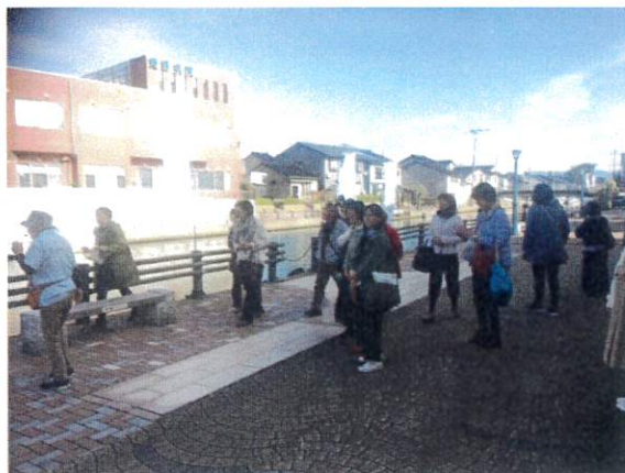
人生の旅路ロケ地を散策