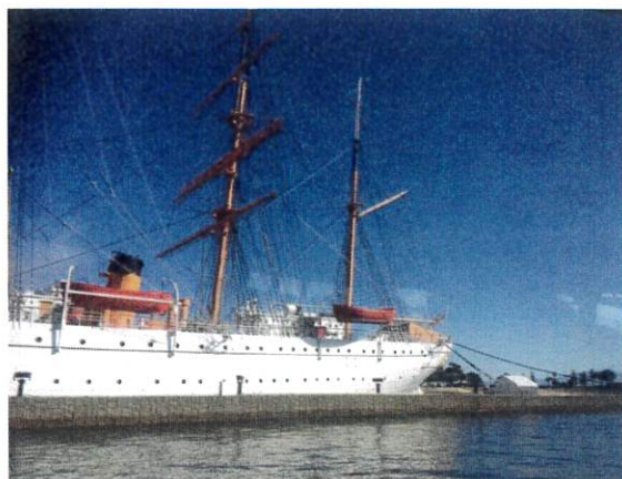
帆を下ろした海の貴婦人海王丸