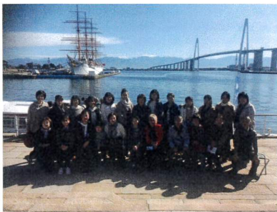
海王丸パークで集合写真！