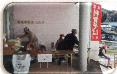
振る舞いかけそば