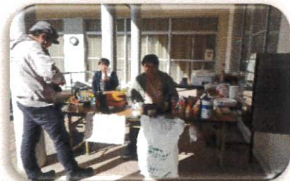
青年団 手作りピザ