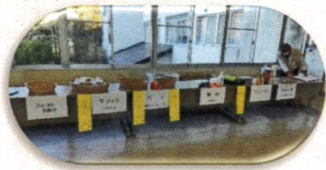
会場入口は飲食・物販売のコーナー

当日は、小中学生や地域の皆様の作品展示や、手作りお菓子の販売、軽スポーツやゲームの体験、減塩みそ汁や食の提供もあり、1日楽しく賑やかな交流の場となりました。