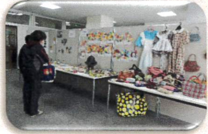
ミーティングルームに並ぶ作品