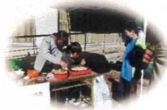
たこ焼き作りを体験!