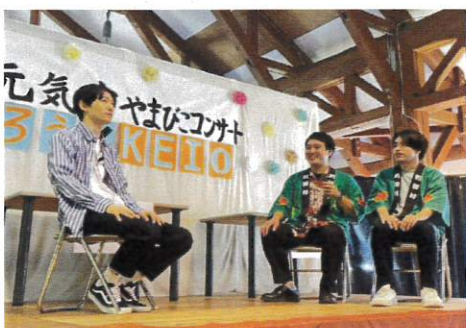
たつろうトークショー