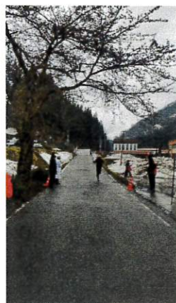
令和4年4月16日(土) 場所：スターフォレスト利賀 上利賀振興会主催