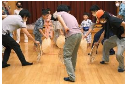
フィナーレは お父さんお母さんも一緒に！