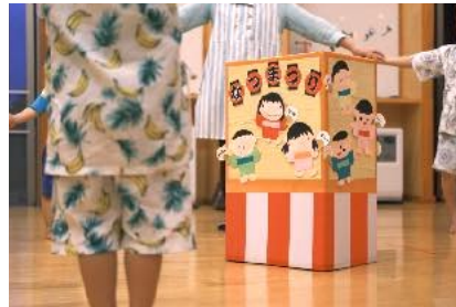
やぐらを囲んで みんな仲良く盆踊り。 練習した成果が 発揮できたかな？