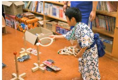
よ〜く狙って、ソレっ！