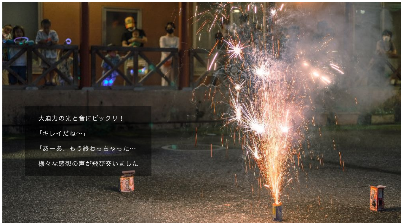
大迫力の光と音にビックリ！ 「キレイだね〜」 「あーあ、もう終わっちゃった…」 様々な感想の聲が飛び交いました