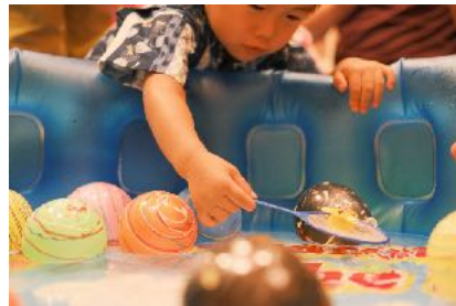
ゆっくり、慎重に…！ お父さんお母さんから アドバイスもらって チャレンジ！

2021年7月9日。利賀ささゆり保育園にて「なつまつり」が行われました。 園児とその家族が集い、園舎内の出店にてヨーヨー釣りや輪投げなどに挑戦！ 一生懸命に、そして可愛らしく披露された盆踊りでは、客席から歓声が上がりました。 空も暗くなった頃には迫力のある花火も打ち上げられ、皆で仲良く一足先に夏の風物詩を堪能しました。