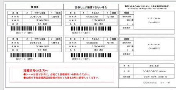
クーポン券（接種券）