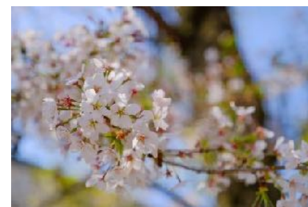
入り口前には大きな桜 木の下でお昼ご飯を食べることも。