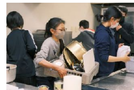
食後の片付けはもちろん自分たちで。 上級生が下級生に教える姿も見られました